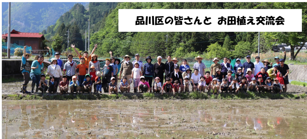
品川区の皆さんと お田植え交流会