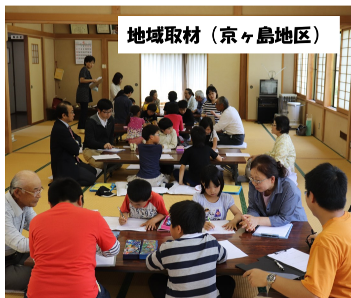
地域取材 (京ヶ島地区)